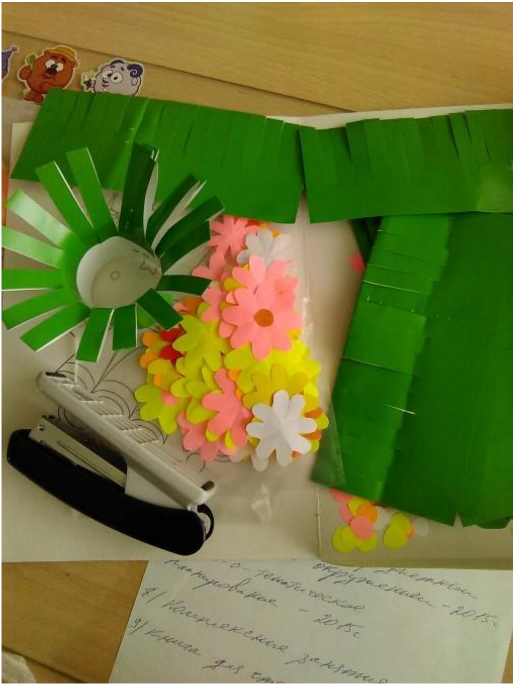
Затем приклеиваем заготовку к картону.